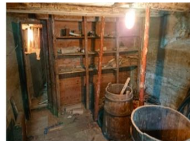
Frå den gamle krambua i kjellaren.